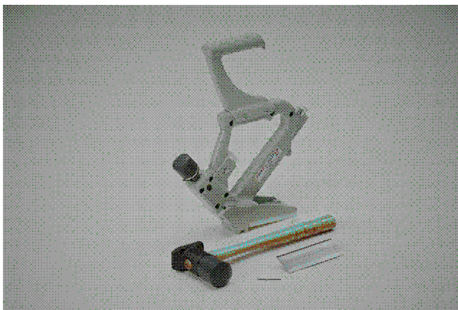
Fig 2 Porta Nailer

Legg ikke ned et bord du ser det er en feil med. Kutt bort feilen, og bruk det til en start eller avslutning.